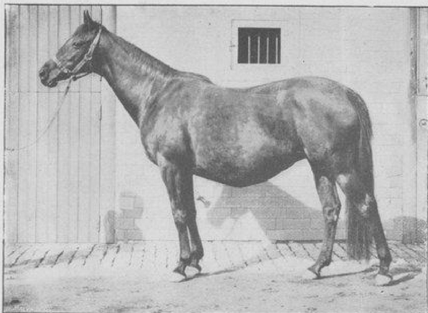
HERSEY, PAR HERMIT ET SYLVA, PLEINE DE MORION.

sont pleines de lui : parmi celles-ci, Georgina , Barberine , La Papillonne , Mignonnelle viennent de donner des produits pleins d'avenir.