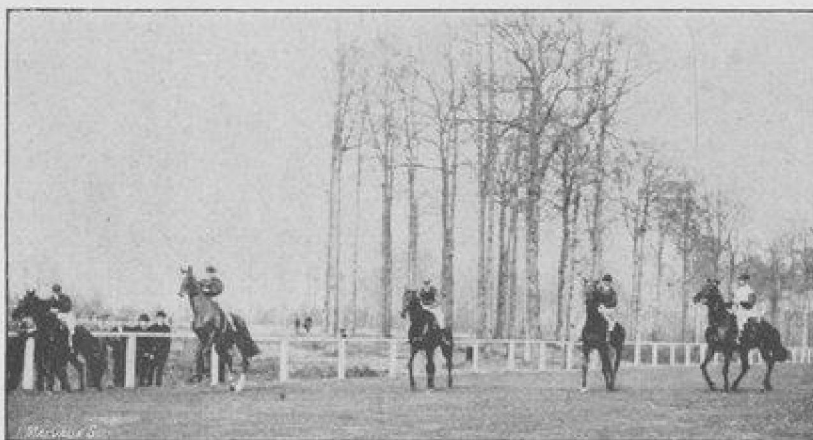
LE DÉPART DU PRIX DE LA CHAPELLE (BOITSFORT, 15 MARS 1896).

Nous donnons ci-joint quelques photographies prises à Groenendael et à Boitsfort, au début de la saison de courses qui a si brillamment commencé. Nous aurions voulu, en cette occasion, donner le portrait de