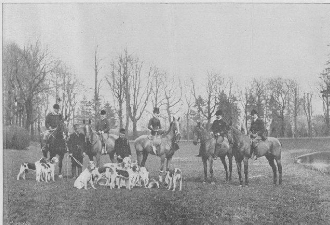
L'ÉQUIPAGE « GOOD HOPE ».

Le terrain de chasse, situé tout autour du château d'Olsene, entre Deynze et Courtrai, se prêtait admirablement à